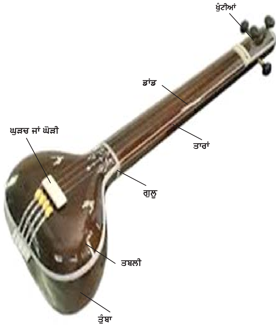
ਚਿੱਤਰ ਨੰ. 1