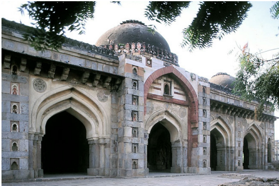
ਮੋਤੀ ਕੀ ਮਸਜਿਦ, ਜਿਸ ਨੂੰ ਸਿਕੰਦਰ ਲੋਧੀ ਦੇ ਰਾਜ ਵਿੱਚ ਉਸਦੇ ਇੱਕ ਮੰਤਰੀ ਨੇ ਬਣਾਇਆ ਸੀ